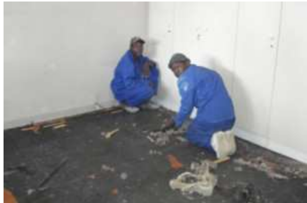
Les travaux de rénovations ont commencé le 25 mars 2009.