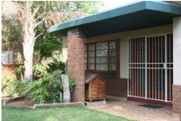
Maison achetée pour être rénovée afin de faire office d'hospice